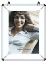
Poster Frame Pro